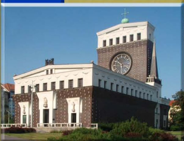
kostel Nejsvětějšího srdce Páně

Zřejmě nejvýznamnější památka Vinohrad: slovinský prof. Josip Plečnik zde ve stylu starokřesťanských bazilik vytvořil dílo evropského formátu. 1932, NOVOKLASICISMUS