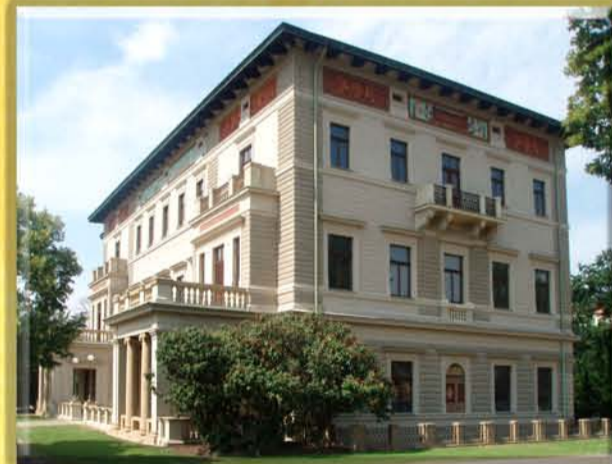
Gröbeho vila Italsky pojatá vila s proslulým parkem. Antonín Barvitijs, 1881, NOVORENESANCE