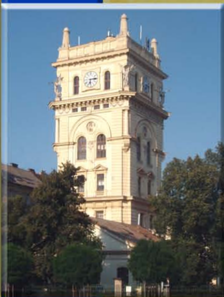
vodárna A. Turek, 1882 NOVORENESANCE