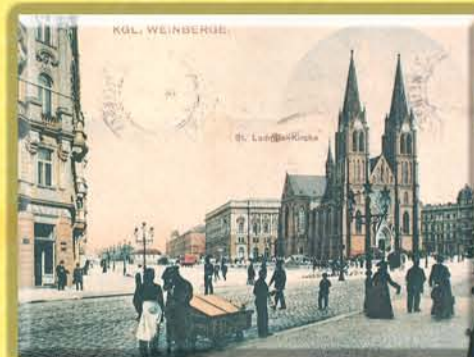
Tehdejší Purkyňovo nám. zatím bez divadla (viz proluka vlevo).

_Reformy naši čtvrť necitlivě rozdělily: 57% do Prahy 2 (s Vyšehradem, částmi Nového Města a Nuslí), zbytek do Prahy 1, 3, 4, 10. Přívlastek "Královské" zrušen 1968.