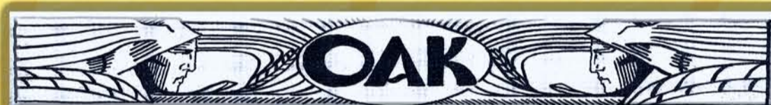
Neoficiální logo školy z časopisu "Mládí" (1925).